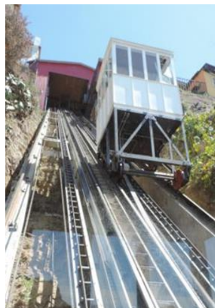
Ascensor Espíritu Santo